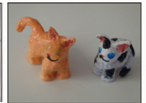
Sculpture de créatures