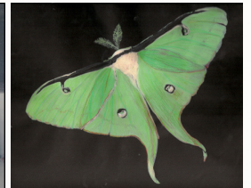
Peinture d'insecte à la Gouache