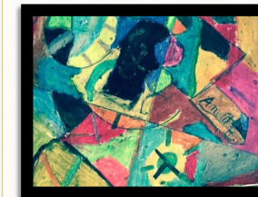
Composition de Pastel à l'huile