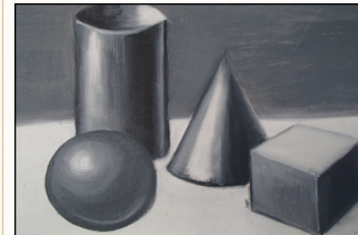
Peinture de la valeur Formes Géométriques

Afin de pratiquer ce cours dans les meilleures conditions, vous recevrez la liste recommandée du matériel nécessaire